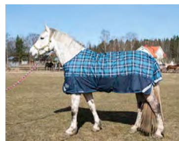
Shires Highlander Storlek 115-155 Pris: cirka 900 kronor www.shiresequestrian.com

Ett väldigt billigt täcke med relativt bra passform. Spännena framtill är reglerbara men tyget knölar sig lätt i bogen. Rymligt framtill och passar därför även hästar med lite bredare bogparti. Täcket har tygfoder över ryggen och nylonfoder i bogen. Det klarade sig helt från skador i tyget men klarade inte regntestet utan läckte in. På bilden syns förra årets färg.