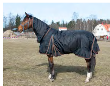
Hansbo Marina Storlek 115-165 Pris: cirka 1100 kronor www.hansbosport.se

Ett lätt täcke med mycket bra passform. Lite smalare modell i bogen, med dubbla bogspännen med snabbfästen. Täcket har bogveck och svansskydd. Efter testet var täcket helt så när som på passpoalen längs kantbandet som lossnat lite baktill. Täcket klarade regntestet bra och höll all väta ute. Det känns rejält och välsytt med välplacerade spännen och lagom halsskärning. Smidigt att hantera.