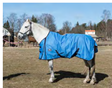
Himalaya regntäcke Storlek 115-165 cm Pris: 388 kronor www.borjes-tingsryd.se

Täcket har en mycket bra passform med lagom skärning i halsen och upplevs som relativt normalt i storleken. Snabbspännen framtill, mjukt mankskydd i neopren och tilltagen svanslapp. Tyget över ryggen på täcket höll bra under testets gång men det gick sönder vid maggjordarna. Täcket höll inte helt tätt vid det sista regntestet utan läckte in över ryggen.