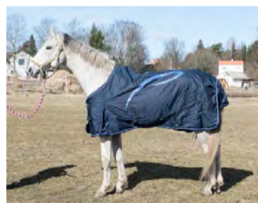
Pessoa Classic Storlek 115-165 cm Pris: cirka 1100 kronor www.kallquist.se